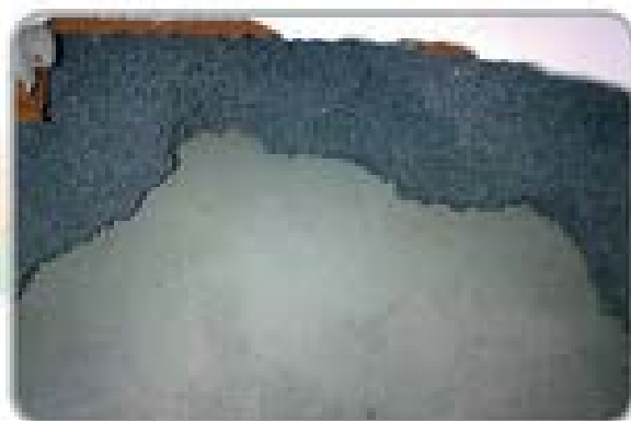
RISULTATO SISTEMA TERMOJET